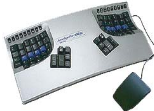
アドバンテージ プロ ■型番: KB510USB-met ・専用フットスイッチ付属 ・ダブルメモリー搭載で、 より長いマクロに対応 ・メモリー内容をロックする スイッチ機能搭載