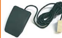
フットスイッチ シングル ■型番: FS007RJ11 ■1ペダル