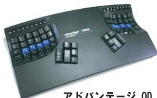
アドバンテージ QD 黒 ■型番: KB500USB/QD ・Devolk配列が印字されています。