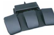
フットスイッチ トリプル ■型番: FS007TAF ■3ペダル