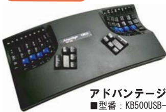
アドバンテージ 黒 ■型番: KB500USB-blk ・スタンダードなタイプ。