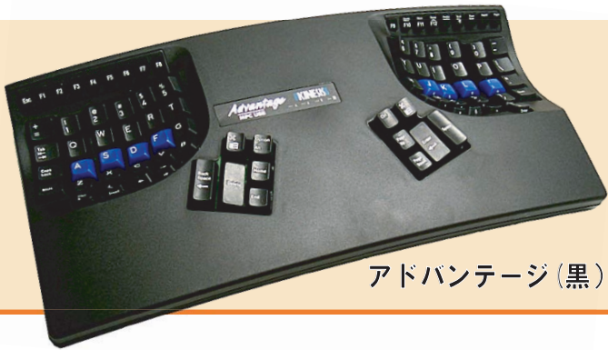
アドバンテージ (黒)

〒330-0801 さいたま市大宮区土手町1-1-4 和幸ビル3F ■FAX: 048-645-7186 ■E-mail: info@edikun.co.jp