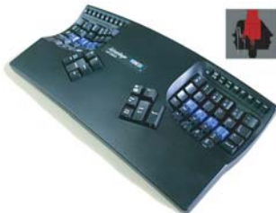
アドバンテージ 黒(赤軸) ■型番: KB500USB-blk-LF ・KB500USB-blkの赤軸タイプ。 人気です。